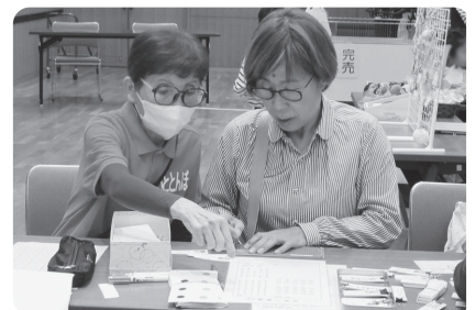
点訳の『いととんぼ』さんの点字体験