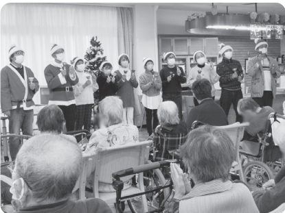
ミュージックベルの演奏

歳末たすけあい運動の一環として、当会の理事と民生委員・児童委員で高齢者施設へ行きました。私たちが奏でるミュージックベルの音色と入所者の皆さんの歌声で音楽を通じた交流もできました。