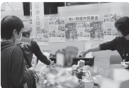
赤い羽根共同募金活動