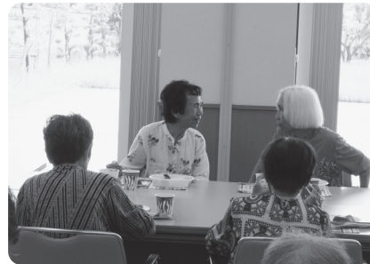
食事とおとした交流