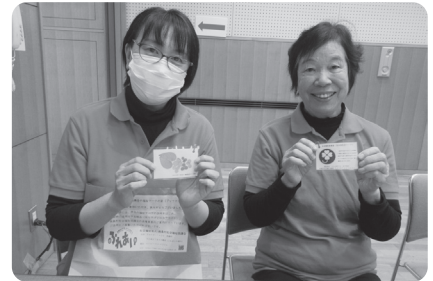
福祉マークの葉づくり