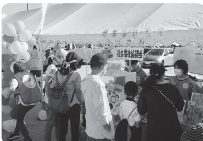
多くの方にご協力いただきました

昨年の村民体育祭では52,758円、健康福祉祭では18,122円の募金が集まりました。 ご支援、ご協力いただきました皆さまに厚くお礼申し上げます。