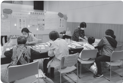
福祉マークの葉づくり

文化祭では、高齢者生きがい活動支援事業「さくらの会」と、さくら作業所の利用者がつくった作品の出品、第76回赤い羽根協賛児童生徒作品コンクールの表彰作品を展示しました。