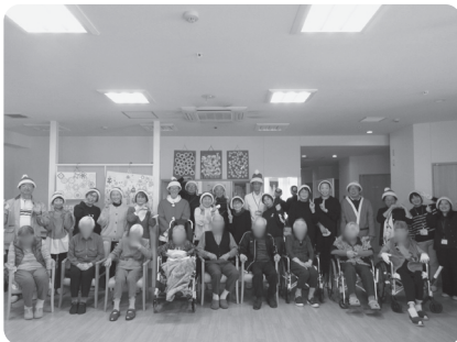
演奏後、全員で記念撮影