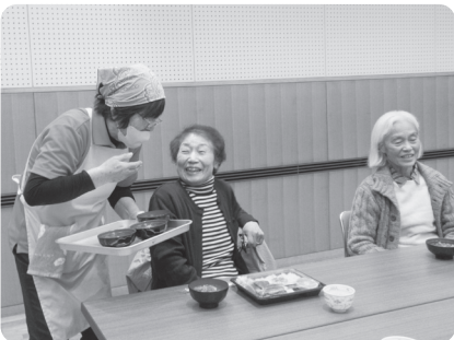
配膳しながら交流

65歳以上のひとり暮らしの方と高齢者世帯の方を対象に「食を楽しむ とびしまショッカン」さんと一緒に開催しました。協力していただいたボランティアさんをはじめ参加した皆さんの笑顔があふれ、美味しいランチで素敵な一日となりました。