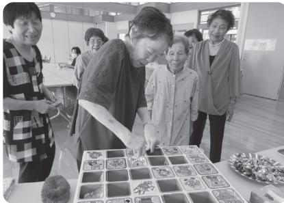
受付でのお楽しみ抽選会

65歳以上のひとり暮らしの方と高齢者世帯の方を対象に、ボランティアグループ「ふれあい会」と一緒に開催しました。参加者の皆さんをはじめボランティアさん、私たち社協職員にとって、皆さんの笑顔とお昼ごはんのカレーライスが素敵な一日を演出してくれました。