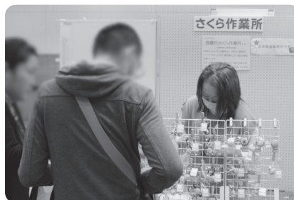
さくら作業所の自主製品販売