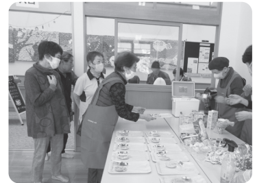
ポスターはボランティアさん作成