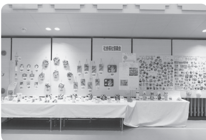
さくらの会の作品