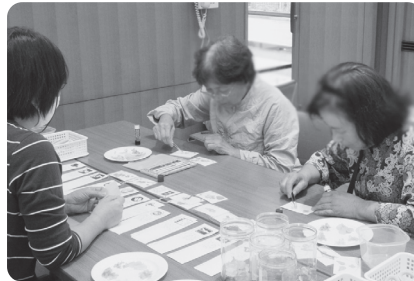
福祉マークの葉づくり