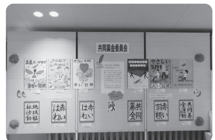
赤い羽根作品コンクールの表彰作品