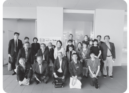
にじいろのいえで記念撮影